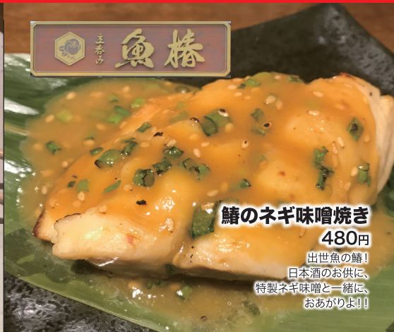
鱈のネギ味噌焼き