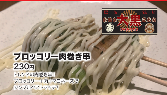
ブロッコリー肉巻き串